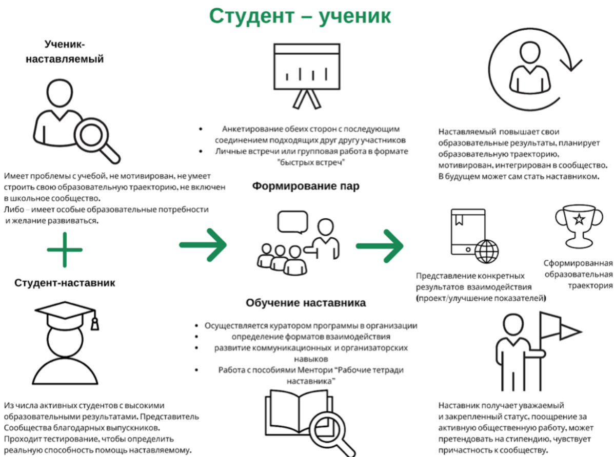
Рис. 3. Графическое представление реализации программы наставничества по форме «студент – ученик».