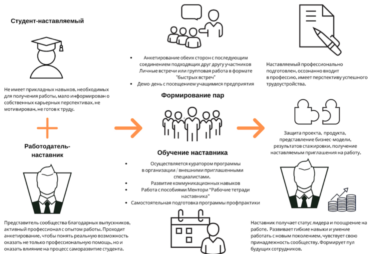
Рис. 5. Графическое представление реализации программы наставничества по форме «работодатель – ученик».