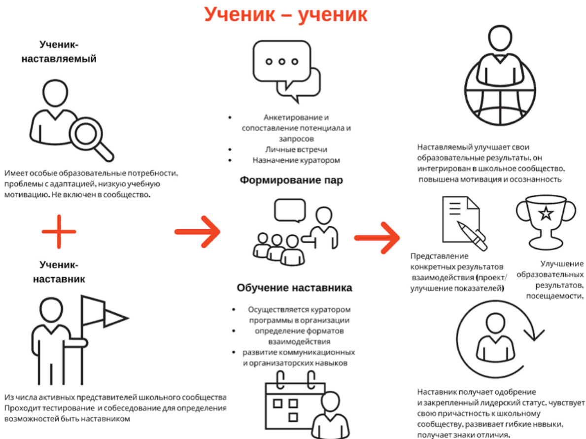
Рис. 1. Графическое представление реализации программы наставничества по форме «ученик – ученик».